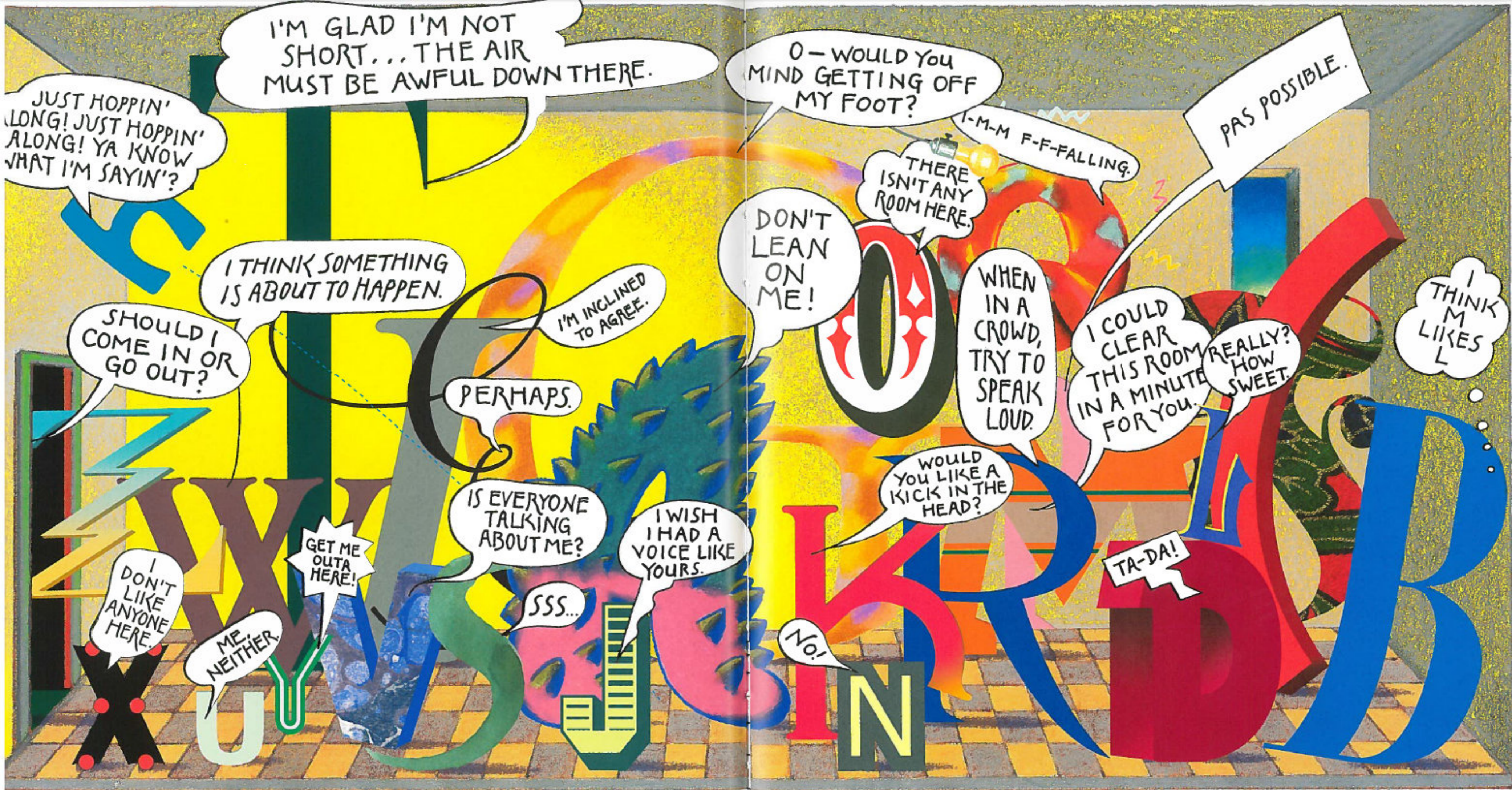
Vain V, Wise W, Xenophobic X, and Yelling Y all pushed in just before Zigzag Z, always the last to arrive.