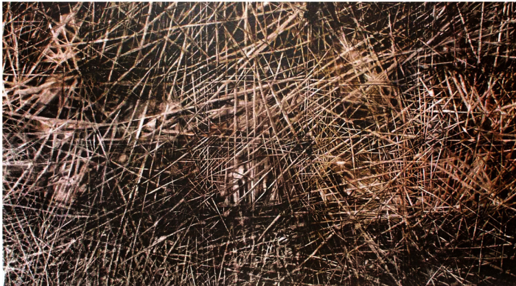
Figura 3 A grande aquarela , de Eliana Zaroni.

O tempo de materialização da obra é semelhante ao tempo de duração da paisagem, a rapidez do pôr do sol é a mesma na produção da aquarela: o tempo real e o tempo poético se igualam, como se o artista repetisse a ação da natureza. Mas não se trata aqui de uma imitação da paisagem, não é uma representação da paisagem real: é paisagem elaborada e incorporada a sua obra (OSTROWER, 1998). Ao longo do processo, as visões das paisagens guardadas na memória do artista formaram um repertório de imagens que mistura realidade e imaginário. Stori transformou-se nela, impôs um tempo pessoal à natureza, o tempo de sua criação artística (CSIKSZENTMIHALYI, 1998a).