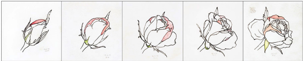
Figura 7 Seqüência de rosas se abrindo , de Paulo Von Poser.

O flow também pode ser deflagrado pela lembrança de uma flor, uma rosa, que inspira o artista Paulo Von Poser ( Dois seqüências de desenhos de rosas se abrindo ) há mais de vinte anos, um apaixonado pela rosa, uma sedução que ele reconhece como tema de uma vida inteira.