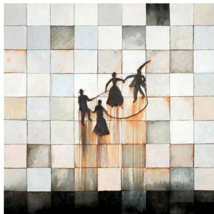
Figura 6 Obra da Exposição "Elogio ao silêncio", de Sergio Fingermann.

O tempo também deixou suas marcas na memória de Sergio Fingermann e aparece nítido em suas pinturas, que registram a oxidação do ferro transformado em ferrugem. Essa ferrugem forma manchas que ficam marcadas na tela, escancarando o tempo implacável e sem retorno: "Vejo estas pinturas, elas têm muito de memória, convocam, como construção de sensação..." (MELLO, 2008, p. 88). Há um tempo residual nessa transformação, que fica marcado, insistindo em permanecer na tela. Diferentemente das gravuras de Weiss, nesse caso o resíduo mancha definitivamente, como uma tatuagem indelével sobre a pele do trabalho.