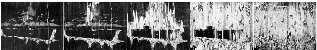
Figura 5 Cinco xilogravuras do navio, de Luise Weiss.

Tempo explicitado na obra escolhida para esta pesquisa, cinco xilogravuras dispostas uma ao lado da outra como se formassem uma sequência. Na primeira, bem escura, vemos um esboço daquilo que pode vir a ser um navio; essa imagem começa a se tornar nítida, conforme a gravura vai sendo feita, pois vai sutilmente clareando, aumentando a quantidade de branco a cada impressão. Na quarta xilogravura, bem clara, o navio aparece nitidamente. Na quinta e última, o navio desaparece imerso em tanto branco, perde sua forma e vemos apenas uma abstração do que foi essa imagem, formando uma textura homogênea.