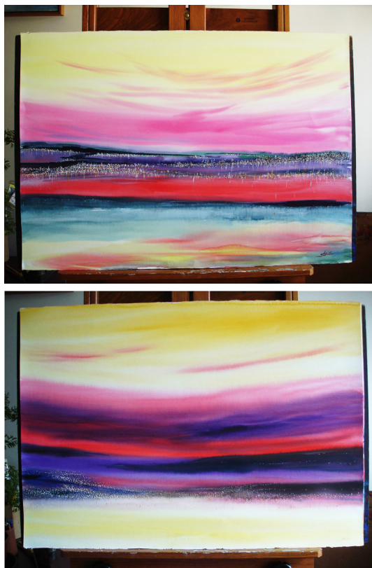
Figura 2 Amanhecer e pôr do sol , de Norberto Stori.