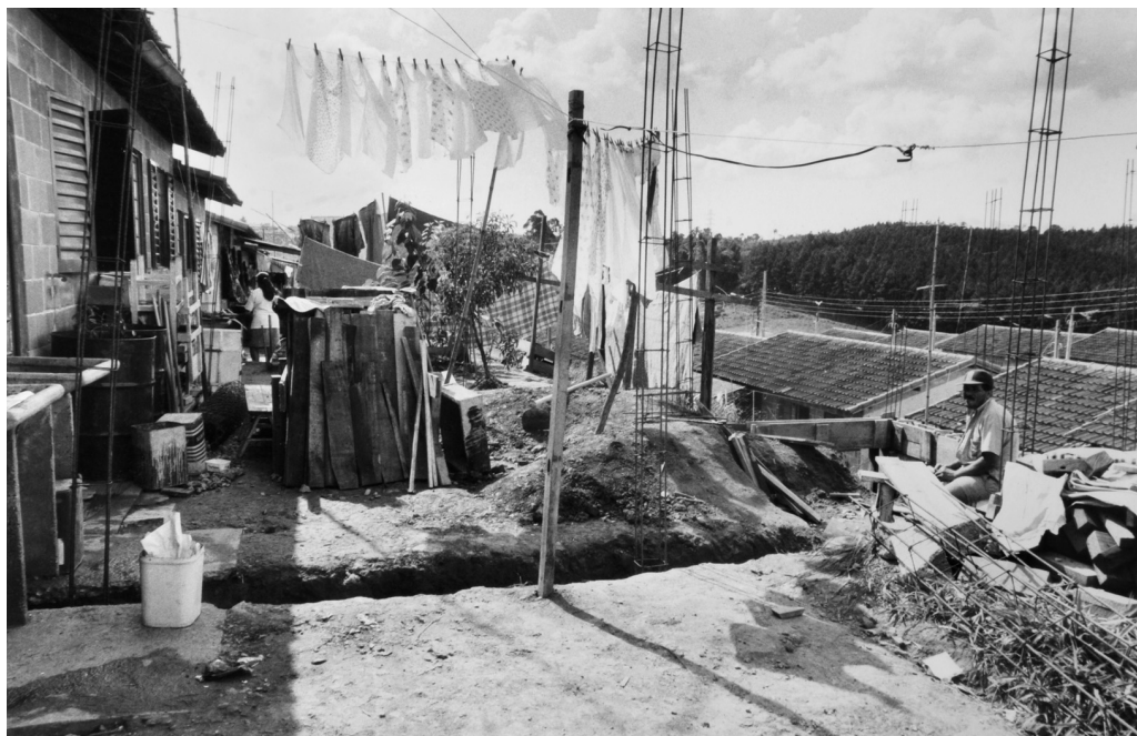
Figura 15 Entorno do terreno da futura Escola Bairro dos Pimentas III – Projeto-Ruy Ohtake