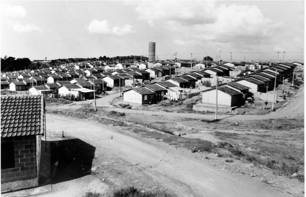
Figura 13 Entorno do terreno da futura Escola Bairro dos Pimentas III – Projeto-Ruy Ohtake