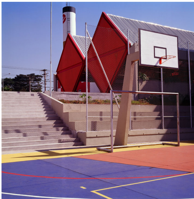
Figura 2 Jardim dos Campeões, Diadema, Rui Otake Arquitetura e Urbanismo S/C Ltda., 1984