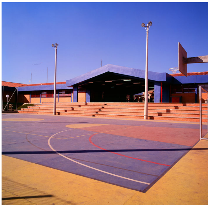
Figura 11 Cruz das Almas, R. Euclides da Cunha s/n, Biritiba Mirim, Sérgio Pileggi & Euclides Oliveira Arquitetura