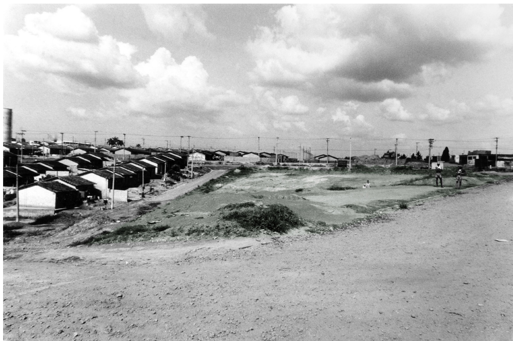
Figura 12 Vista do terreno da futura Escola Bairro dos Pimentas III – Projeto-Ruy Ohtake