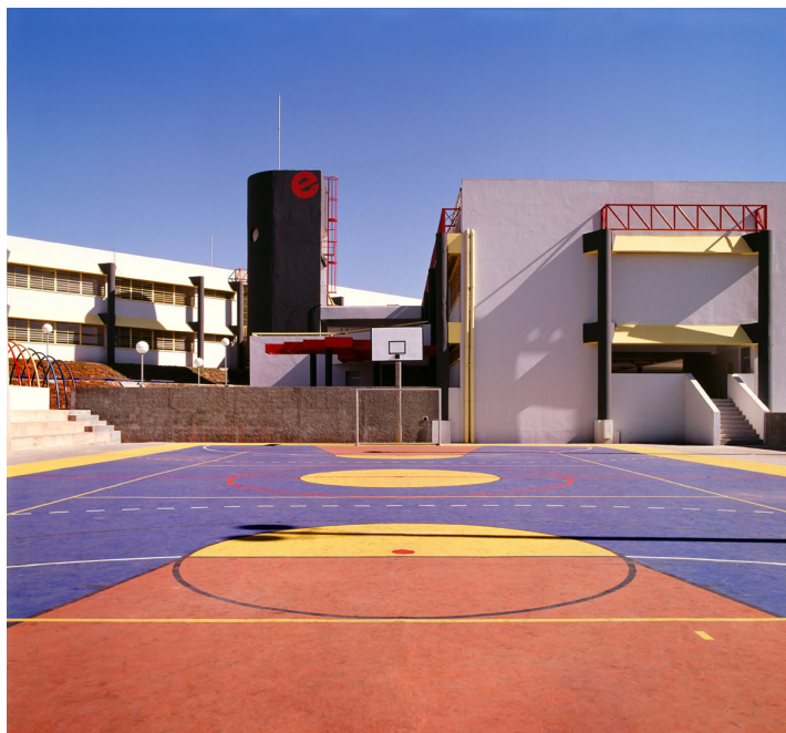
Figura 5 Vale dos Pinheiros, Taboão da Serra, Luciani Associados Arquitetura S/C Ltda.