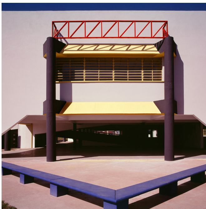
Figura 6 Vale dos Pinheiros, Taboão da Serra, Luciani Associados Arquitetura S/C Ltda.