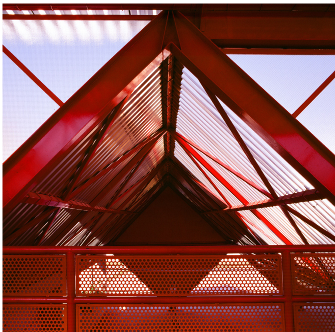
Figura 3 Jardim dos Campeões, Diadema, Rui Otake Arquitetura e Urbanismo S/C Ltda., 1984