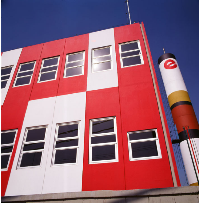
Figura 1 Jardim dos Campeões, Diadema, Rui Otake Arquitetura e Urbanismo S/C Ltda., 1984