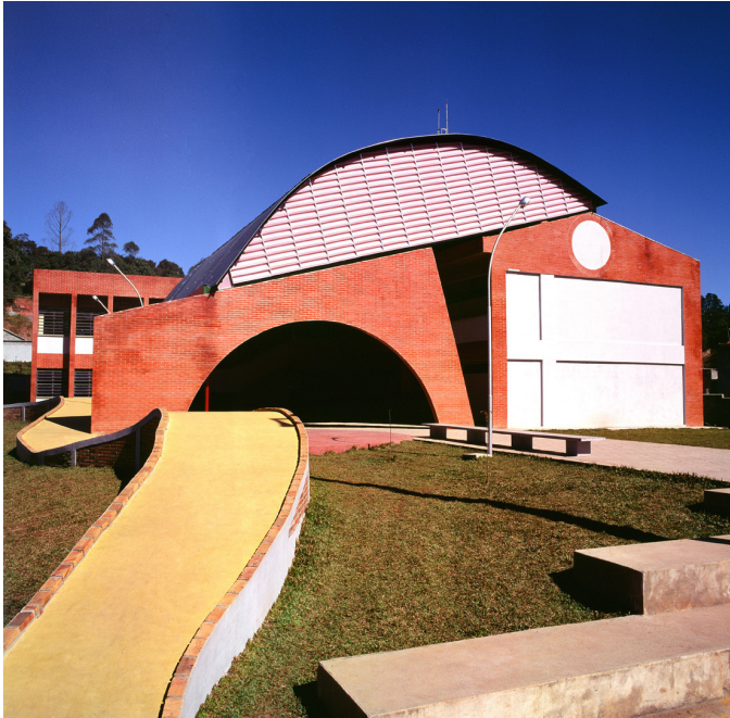
Figura 9 Jardim Santista, Bairro Soma, Ribeirão Pires, Carlos Bratke Arquitetura S/C Ltda.