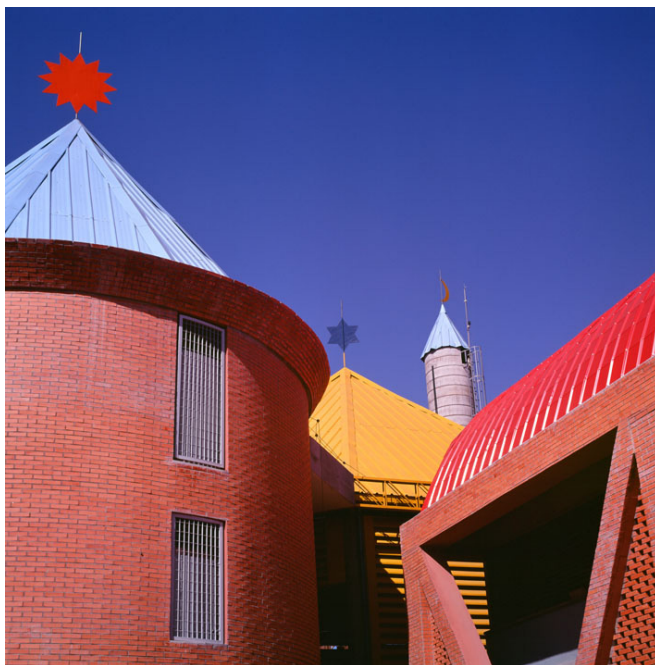
Figura 8 Rua Pedro Ozório Júlio, Lauzane Paulista, Carlos Bratke Arquitetura S/C Ltda.