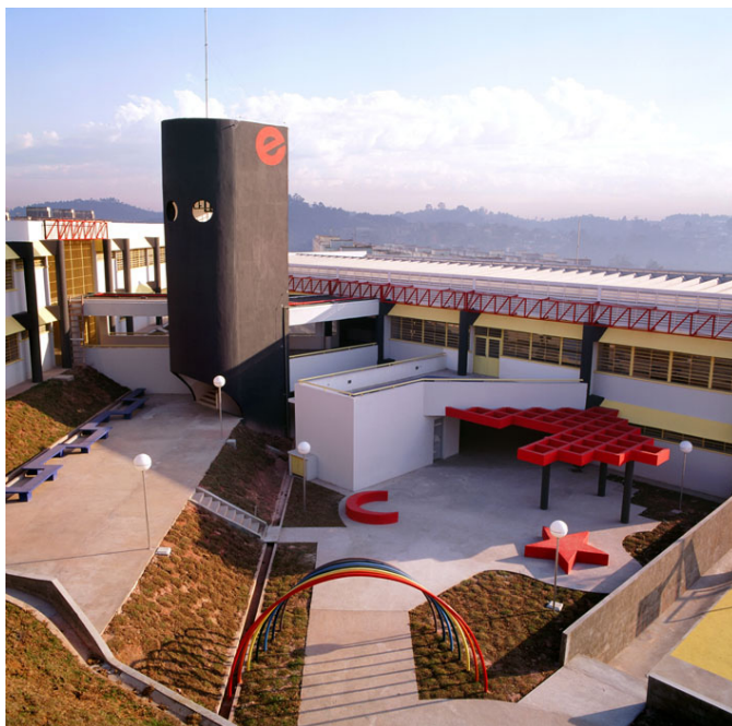
Figura 4 Vale dos Pinheiros, Taboão da Serra, Luciani Associados Arquitetura S/C Ltda.