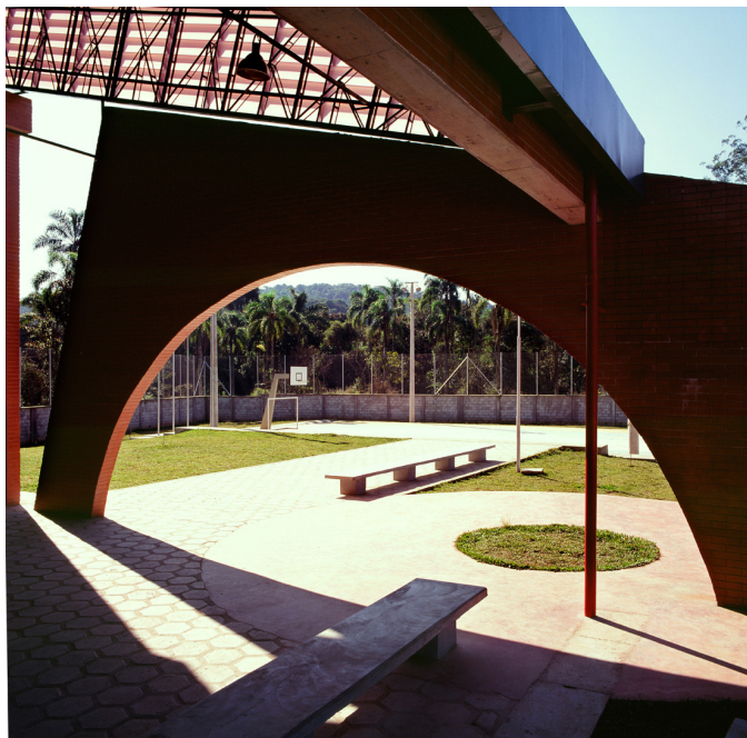
Figura 10 Jardim Santista, Bairro Soma, Ribeirão Pires, Carlos Bratke Arquitetura S/C Ltda.