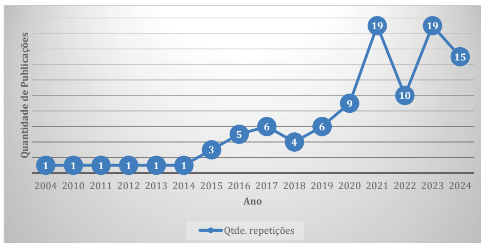
FIGURA 2 – Evolução da quantidade de publicações por ano