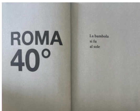
Figura 1 – “Roma 40°” (texto que integra Gran cabaret demenzial )

gênero, embora os livros da autora sejam composições ficcionais que englobam textos escritos sob diversos gêneros, como contos, peças teatrais, outras formas de difícil classificação, como anúncios ou propagandas, que aparecem, por exemplo, em Gran cabaret demenzial .