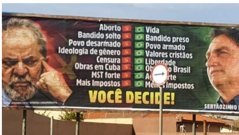
Figura 2 – Outdoor “Você decide”

No exemplo concernente ao posicionamento do discurso da direita, agora situado no contexto das eleições de 2022, o que não implica que não sejam levantadas as mesmas pautas de 2018, na verdade são quase as mesmas, 5 poderemos perceber que os mecanismos de estereotipação são enunciados até de maneira estruturada, numa contraposição clara entre semas de um discurso vistos a partir do universo axiológico de um discurso que o julga e o tipifica . Na imagem a seguir, vemos claramente um jogo, que também compreende a dimensão imagética, de contraposição fortemente axiologizada dos dois candidatos das eleições de 2022.