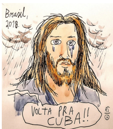
Figura 1 – Jesus crucificado no Brasil

As aproximações do discurso bolsonarista a um discurso fascista não foram poucas nas últimas eleições no Brasil; em contrapartida, a esquerda foi constantemente tachada de comunista. Por ocuparem os polos nessa zona de estrutura gradual, os termos se carregam de aspectos intensos e tipificados, o que os faz, como escolhas lexicais, terem uma dimensão argumentativa de intensificação e estereotipação, podendo ser vistos, um aos olhos do outro, e a depender do ponto de vista de base, ora como eufemismo , ora como hipérbole , o que demonstra um apelo sensível da ordem de figuras de linguagem, usadas com fins de impacto. Na gravura e no outdoor que apresentaremos, temos exemplos situados das relações polêmicas entre os dois posicionamentos. Vejamos a gravura, situada no contexto das campanhas eleitorais de 2018.