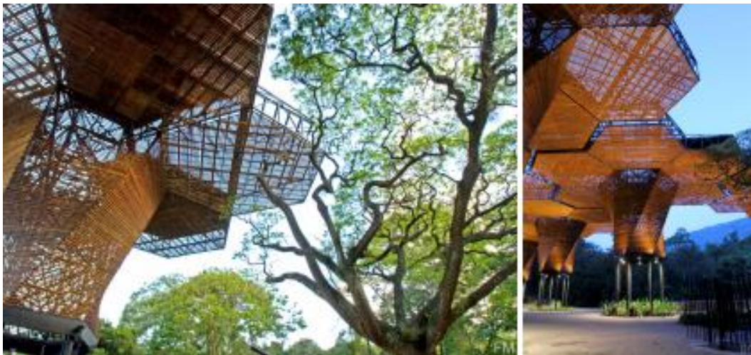
Figura 6 – Orquídeorama, Jardín Botánico de Medellín, JPRCR + Plan B, 2005-2006.

calidades lumínicas y ambientales que ofrece el follaje de los árboles, dialogando con la naturaleza durante el día y en su completo desafío durante la noche.