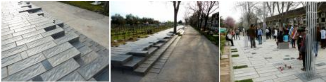
Figura 3 – Proyecto Memorial Patio 29 / García, Rozas, De Simone, Torres, Agosin, Silva, Muñoz, Cementerio General, Santiago de Chile, 2010.

En la propuesta del Patio 29 del Cementerio General de Santiago, ambiguamente se presenta como una plataforma inacabada por su forma irregular dentada se manifiesta abierta al cambio al albergar espacios sombreados que revelan su espesor. Igualmente, su materialidad texturizada, reflectante y sus sutiles cambios cromáticos hacen que, dependiendo de la luz, la superficie se desintegre en pequeñas ondulaciones que lo hacen parecer líquido. Se elimina así su inicial dureza material para en la experiencia del espacio, suavizar sensible y simbólicamente, la separación entre el aquí, el ahora y el pasado de aquellos seres desaparecidos.