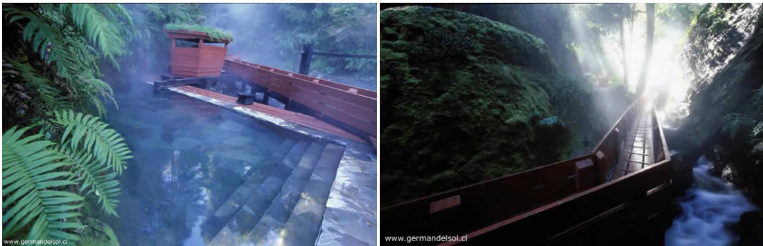
Figura 8 – Germán del Sol, Termas geométricas, Parque Nacional Villarrica, Chile, 2009.

sonidos, se me aparecen como ya ahí, encuentro un hilo que había soltado y que no está roto.