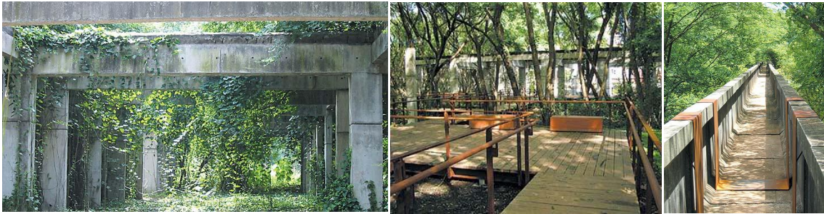
Figura 5 – Parque da Juventude, Sao Paulo, Brasil, Rosa Grena Kliass, 2004.