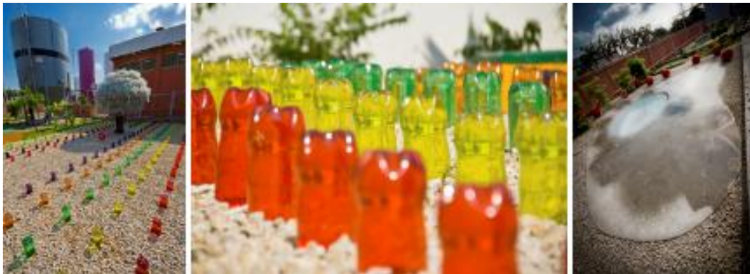
Figura 7 – Parque Agua Vital, Planta Femsa Coca-Cola, Maracaibo, Venezuela, Lourdes Peñaranda, 2010.

La iluminación y el reflejo no juegan, pues, su papel más que si se difuminan, como intermediarios discretos, y si conducen nuestra mirada en lugar de retenerla. Pero ¿qué hay que entender con ello? Cuando se me conduce, por un piso que no conozco, hacia el dueño de la casa, hay alguien que sabe en lugar mío; para él el desarrollo del espectáculo visual presenta un sentido, va hacia un objetivo, y me remito o me presto a este saber que yo no tengo. Cuando se me hace ver, en un paisaje, un detalle que no supe distinguir solo, hay alguien que ya vio, que ya sabe dónde hay que situarse y adónde hay que mirar para ver.