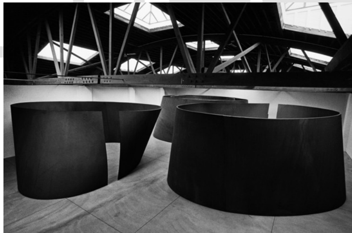
Figura 4: Torqued Ellipses no Dia Center for the Arts , Nova York, 1998.

“Em termos das condições ideais para a localização das Torqued Ellipses , estou interessado numa referência externa da arquitetura. O exterior da forma é melhor compreendido, sua definição é mais clara em relação com um plano vertical do que seria em relação com uma paisagem muito aberta. Estou muito satisfeito com elas no espaço em que estão agora. Imediatamente se vê a projeção de 1,5m da Torqued Ellipse devido à parede próxima a ela. [...] No Dia , não se percebe a arquitetura: o que se percebe é o concreto, as chapas de aço e as tesouras de madeira da cobertura, seus entrelaçamentos e cruzamentos. O edifício é reduzido ao piso, ao teto e à superfície externa dos volumes de aço. O conteúdo entre piso e teto fica integrado às peças. Se levássemos essas peças para o exterior ou se houvesse maior altura no espaço ou uma definição mais clara do teto, seríamos capazes de ler a elipse no topo mais facilmente como uma forma regular rotacionada com relação à base da elipse. Aqui no Dia , as tesouras interferem na leitura das bordas do topo da elipse. [...] Todas essas condições atuam quando observamos as peças. O concreto e o madeiramento da cobertura encapsulam o volume. As paredes parecem desaparecer. Elas não são percebidas, assim como não se percebe a largura do espaço. Quando se caminha na sala, não se está numa sala com peças dentro, mas no espaço entre as peças.” 13