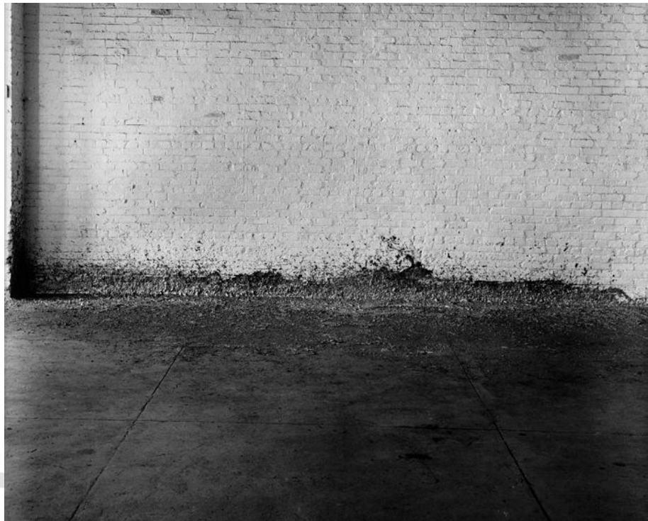
Figura 2: Splashing , de Richard Serra, Castelli Warehouse, Nova York, 1968.

Fonte: Foto de Peter Moore cedida como cortesia por Richard Serra Studio. © Richard Serra/Artists Rights Society (ARS). Disponível em: