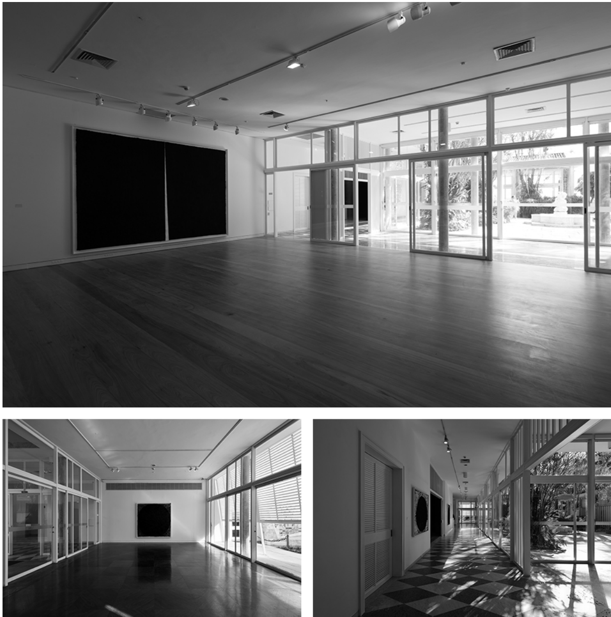
Figura 1: Vistas da exposição Richard Serra: desenhos na casa da Gávea no IMS, Rio de Janeiro, 2014.