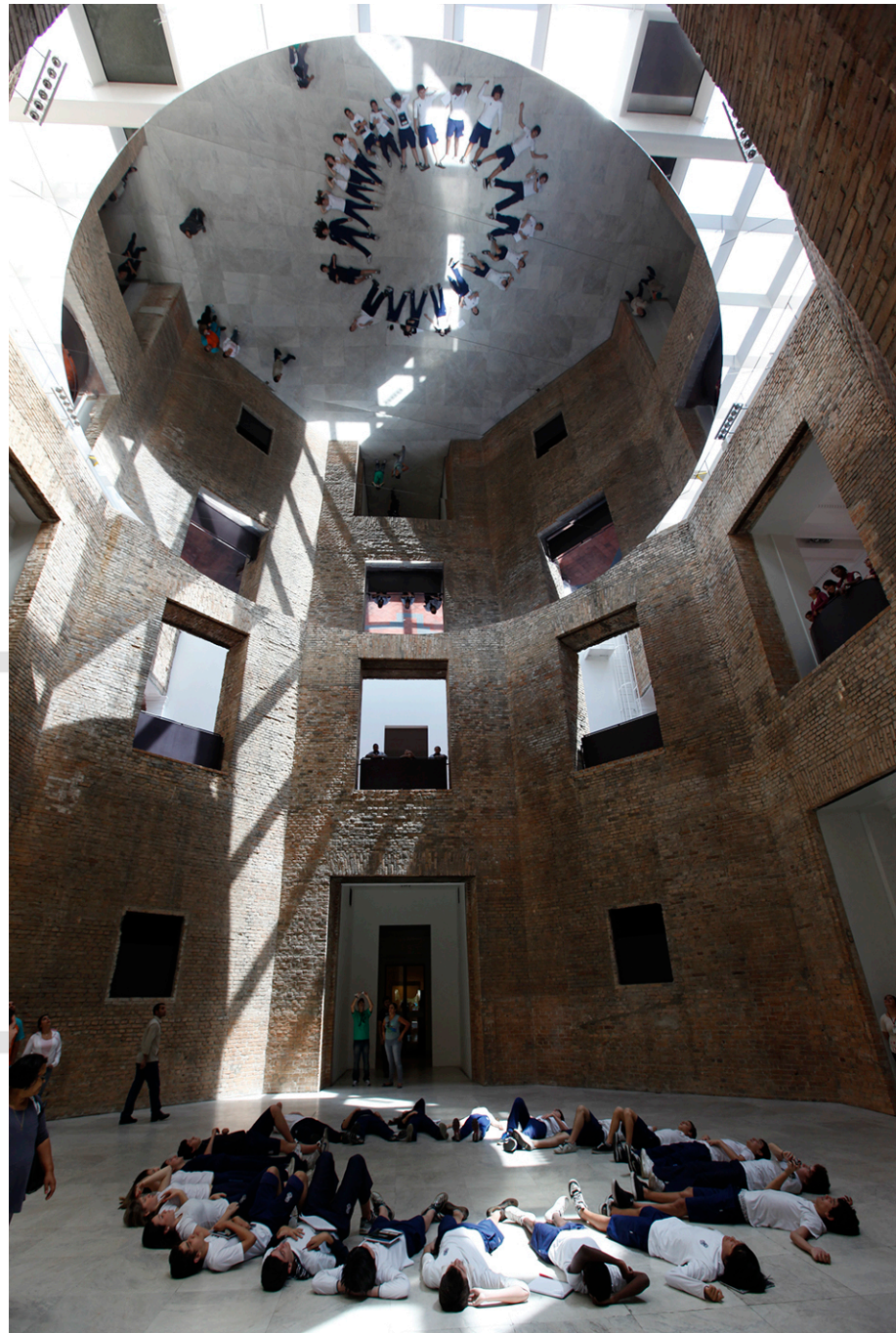
Figura 7: Take your Time de Olafur Eliasson na Pinacoteca, São Paulo, 2011. Coleção Particular, Suíça.

A possibilidade de Take Your Time ser instalada em locais distintos indica que a obra independe das características particulares do espaço, incluindo dimensões mais imateriais suscitada por suas memórias. Não tendo sido concebida especialmente para o Octógono , não há um diálogo com aspectos simbólicos que transcendem as condições físicas do espaço e a literalidade do que se vê, como ocorre com a obra de Arthur Leshner, Inabsência , instalada no mesmo local,