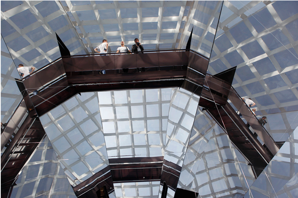
Figura 5: Microscópio para São Paulo de Olafur Eliasson na Pinacoteca, São Paulo, 2011.

o percurso regular de acesso às exposições do museu pela passarela do nível de entrada que cruza a obra. A sensação é de desorientação, surpresa e maravilhamento, uma vez que, em vez de se deparar com a visão conhecida das paredes de tijolos do pátio, o visitante vê em todas as faces ao redor de si o reflexo do céu, entrecortado pela grelha metálica da cobertura transparente, e a passarela do nível acima. Trata-se, portanto, de uma obra site-specific , ao absorver em seu interior os elementos-chave da arquitetura do edifício, que se tornam inseparáveis da obra propriamente dita.