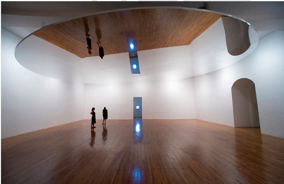
Figura 6: Take your Time de Olafur Eliasson, MoMA P.S.1, Nova York, 2008. Coleção Particular, Suíça.

Eliasson preferiu o Octógono às salas fechadas da Pinacoteca para reinstalar a obra Take your time , que dava o título a uma retrospectiva do artista realizada no MoMA e no P.S.1 de Nova York em 2008. Essa obra é composta de um plano espelhado circular inclinado, suspenso à altura do teto e em rotação pelo eixo central, levando os espectadores a deitar no chão para contemplar sua imagem e a do edifício refletidas acima. 16 No P.S.1, a obra foi instalada numa sala convencional, com paredes e tetos brancos, na proporção de uma sala de aula, que era seu uso original. Ao remontá-la no Octógono da Pinacoteca, com sua geometria espacial, proporção vertical e materialidade marcada pelas paredes de tijolo à vista, o artista assumiu as características bastante particulares e distintas das condições originais, trazendo novos elementos para a relação do espectador com a obra.