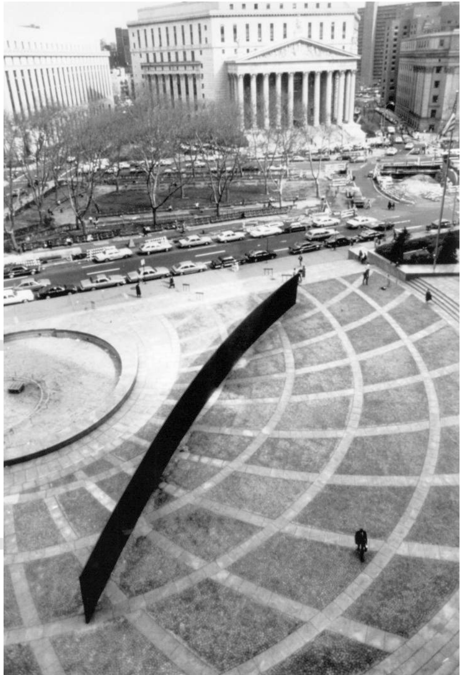
Figura 3: Titled Arc de Richard Serra, Nova York, 1981.

Fonte: Foto de Anne Chauvet cedida como cortesia por Richard Serra Studio. Disponível em: < http://spacing.ca/toronto/2016/05/12/going-public/ >. Acesso em: 21 maio 2017.